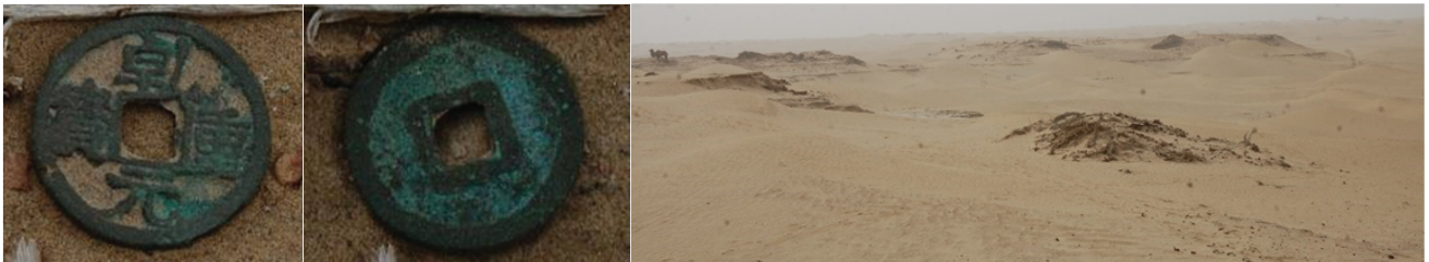
图5 新疆大学地貌考察成员在丹丹乌里克遗址地表发现的乾元重宝(现存于田县博物馆)

丹丹乌里克是位于新疆策勒县北部约90 km的塔克拉玛干沙漠腹地的建筑群遗址,在斯文·赫定的考察报告中被称为“塔克拉玛干古城” [10] . 19世纪80年代,丹丹乌里克的一些材料就流失于海外 [30-32] . 斯文·赫定首次考察了这里,并在1896年发掘了一些房屋与佛寺遗址 [10] . 在随后的1900年至1901年,斯坦因对丹丹乌里克进行了大规模的挖掘,并盗走大量文物 [33] . 德国特灵克勒探险队在1927年到达这里并盗走粟特文的写本和木锁 [34] . 中华人民共和国成立后,新疆文物考古研究所的张铁男、肖小勇分别于1996年、1997年到遗址做了探察 [35,36] . 2002年至2006年,新疆文物局组织中日联合丹丹乌里克遗址考察队对这里进行了正式发掘,认为该遗址为我国唐代所设安西四镇中于阗军镇防御体系中的重镇“杰谢”旧址 [37] .