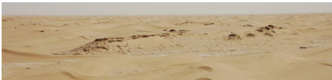
(b) 圆沙古城(自西向东望)