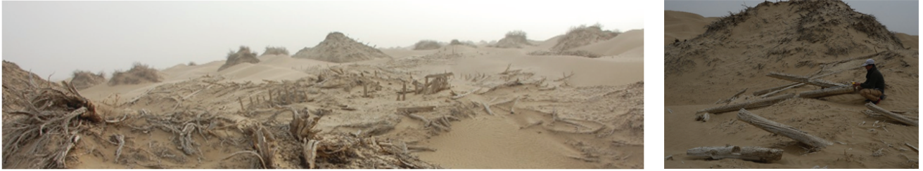
图4 建在红柳沙堆间的喀拉墩古城,古城木制建筑具卯榫结构

Fig 4 The Karadun Site located in the Tamarix mount, noting the beams and pillars were with rafters and mortise structures