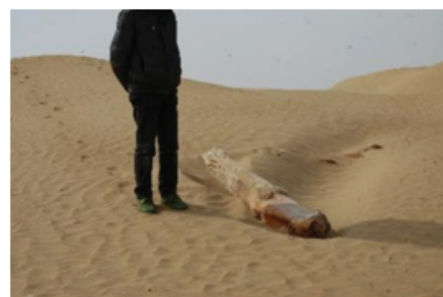
(b) 立木,小河文化中用于女性棺墓前,埋入端红色